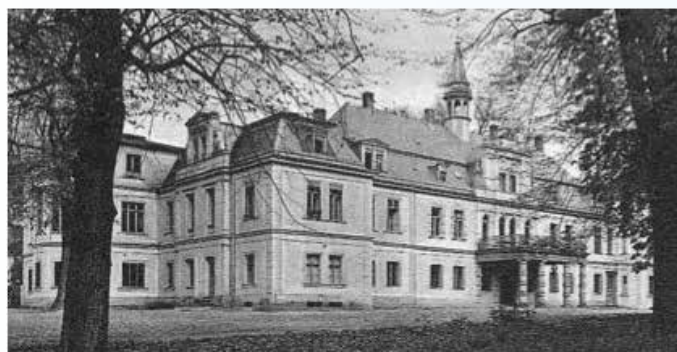
Schloss Kobierzyce/Koberwitz bei Wroclaw/Breslau (Polen)